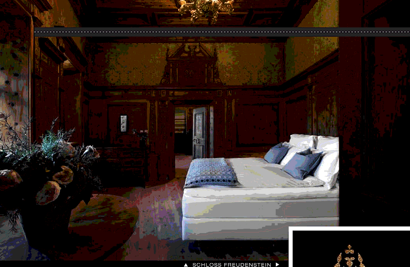
▲ SCHLOSS FREUDENSTEIN ►